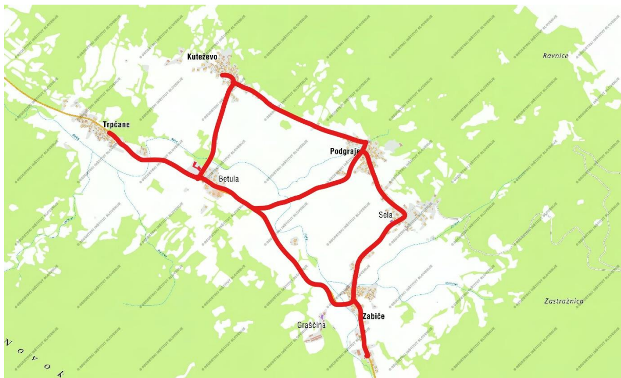
Zemljevid 4: Poti, ki jih učenci uporabljajo za pot do šole s kolesom

Na območju naselij šolskega okoliša sicer manjkajo ustrezne površine za kolesarje. V kolikor bi kolesarske poti bile urejene, bi se precej večji delež učencev v šolo in domov odpravil na kolesu, kar se je izkazalo tudi v anketi iz leta 2022. Mlajšim učencem pogosto že starši odsvetujejo kolesarjenje po glavni prometnici, saj je, kot smo že predhodno zapisali, hitrost mimo vozečih vozil precejšnja in predvsem v jutranjih urah predstavlja veliko nevarnost zaradi slabše vidljivosti.