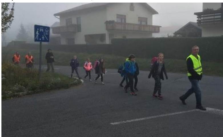
Slika 14: Utrinek iz prve izvedbe Pešbusa, oktober 2018

V šolskem letu 2023/ 2024 smo v septembru in juniju že šesto leto izvedli t.i. Pešbus iz vasi Trpčane, Kuteževo in Podgraje, s čimer želimo učence (in starše) opogumiti in motivirati, da bi vsaj iz te smeri do šole pogosteje prihajali peš. Akcijo smo prvič izvedli v šolskem letu 2018/2019. V vseh šestih dosedanjih izvedbah se je Pešbusa udeležilo okrog 30 učencev, večinoma iz razredne stopnje. Pohvale gredo predvsem spremljevalcem, ki so že kar stalni, saj brez njih izvedba ne bi bila mogoča. Kljub temu, da učenci v času akcije z veseljem hodijo peš v šolo, običajno s hojo prenehajo, ko je konec akcije. Torej sami ne nadaljujejo s hojo v šolo, ampak jih ponovno pripeljejo starši oz. gredo z avtobusom. Z akcijo nadaljujemo tudi v tem šolskem letu, in sicer predvidevamo tritedensko izvajanje v septembru in enako v juniju.