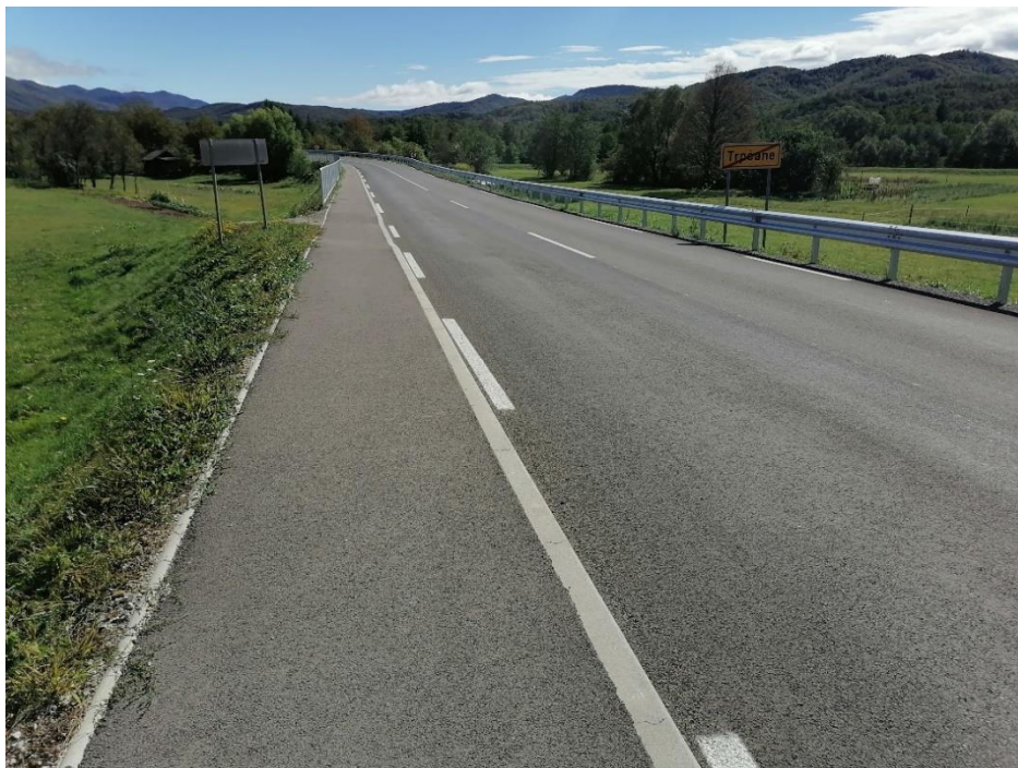
Slika 13: Urejen pločnik med vasjo Trpčane in osnovno šolo

V letu 2021 so bila dokončana dela na pločniku med vasjo Trpčane in osnovno šolo. Postavljena je tudi zaščitna ograja na odseku, kjer je bankina visoka in strma. Še vedno pa ni urejeni prehod za pešce na začetku vasi Trpčane (v smeri proti Ilirski Bistrici).