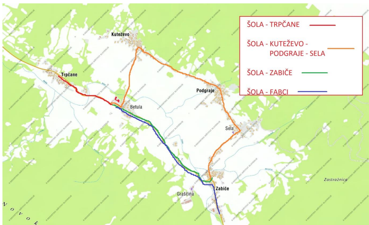
Zemljevid 2: Cestni odseki, po katerih se učenci z organiziranim prevozom vozijo v šolo in iz šole