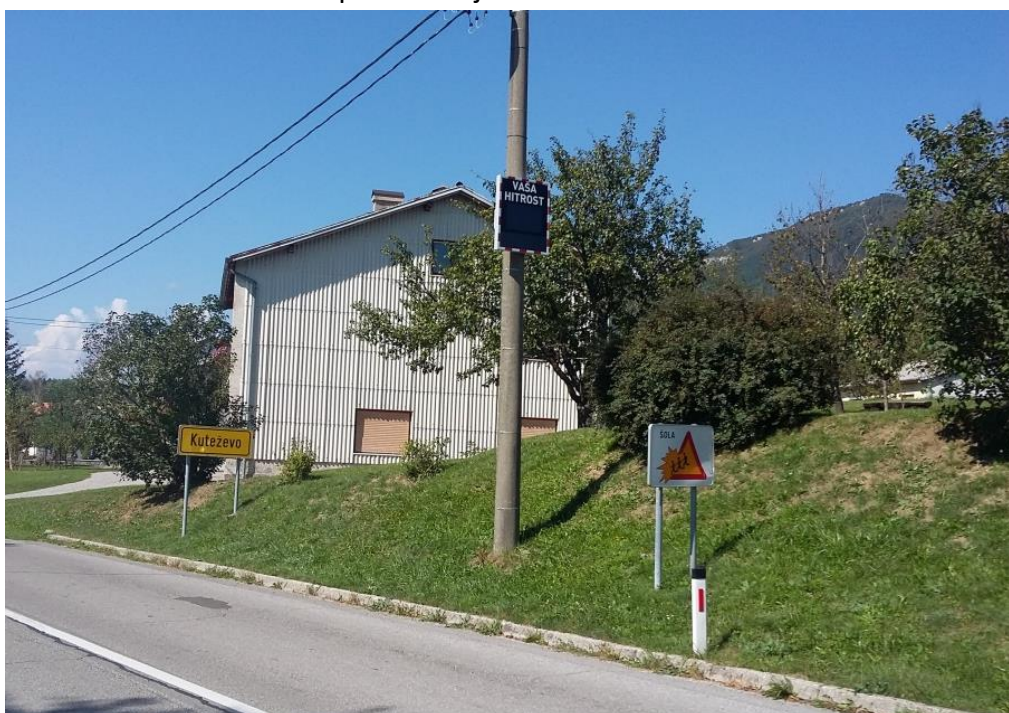
Slika 7: Radarski merilnik hitrosti pred naseljem Kuteževo

V šolo običajno vsak dan prihaja peš le ena učenka, ki živi v neposredni bližini šole v Kuteževem na Betuli. V tem delu naselja je urejen pločnik za pešce, označeni so tudi prehodi za pešce, kar omogoča varno pot do šole. Učenci sicer na svoji poti ne prečkajo regionalne ceste med Ilirsko Bistrico in Zabičami (632). V letu 2018 je bil na začetku naselja Kuteževo v smeri Ilirska Bistrice na regionalni cesti postavljen radarski prikazovalnik hitrosti, kar naj bi pripomoglo k nižji hitrosti voznikov mimo šole. Tam je sicer omejitev 50 km/h, vendar se te omejitve drži le skromen delež voznikov. Potreben bi bil pogostejši nadzor policistov z merilniki hitrosti.