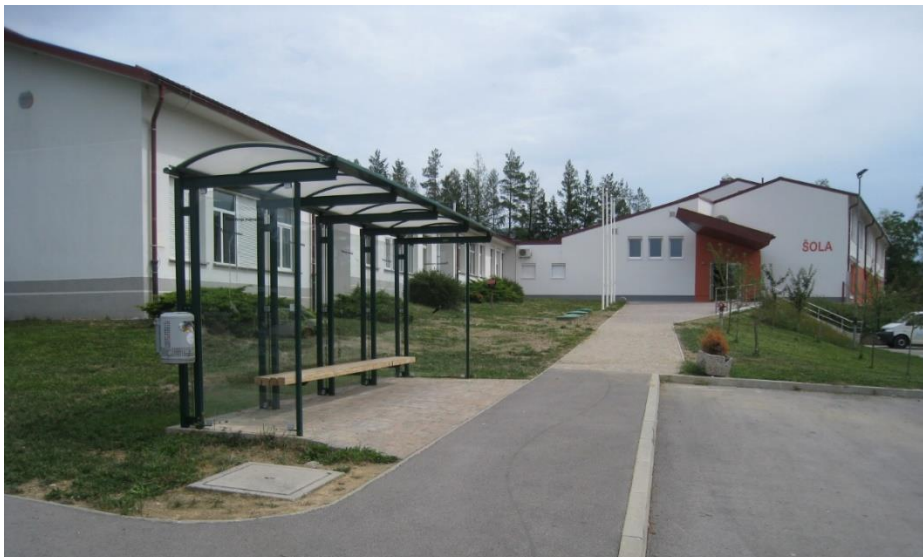
Slika 1: Šolsko avtobusno postajališče

Šolski avtobus ustavlja na določenih mestih/ postajališčih po omenjenih vaseh, ki so uradno določena s strani Komisije za tehnično urejanje prometa pri Občinskem svetu za preventivo in vzgojo v cestnem prometu, vendar niso ustrezno opremljena. Izjema sta avtobusni postajališči v Trpčanah, ki sta ustrezno opremljeni in označeni. Na postajališču na Selih je postavljena zastekljena avtobusna postaja (premaknjena iz Zabič).