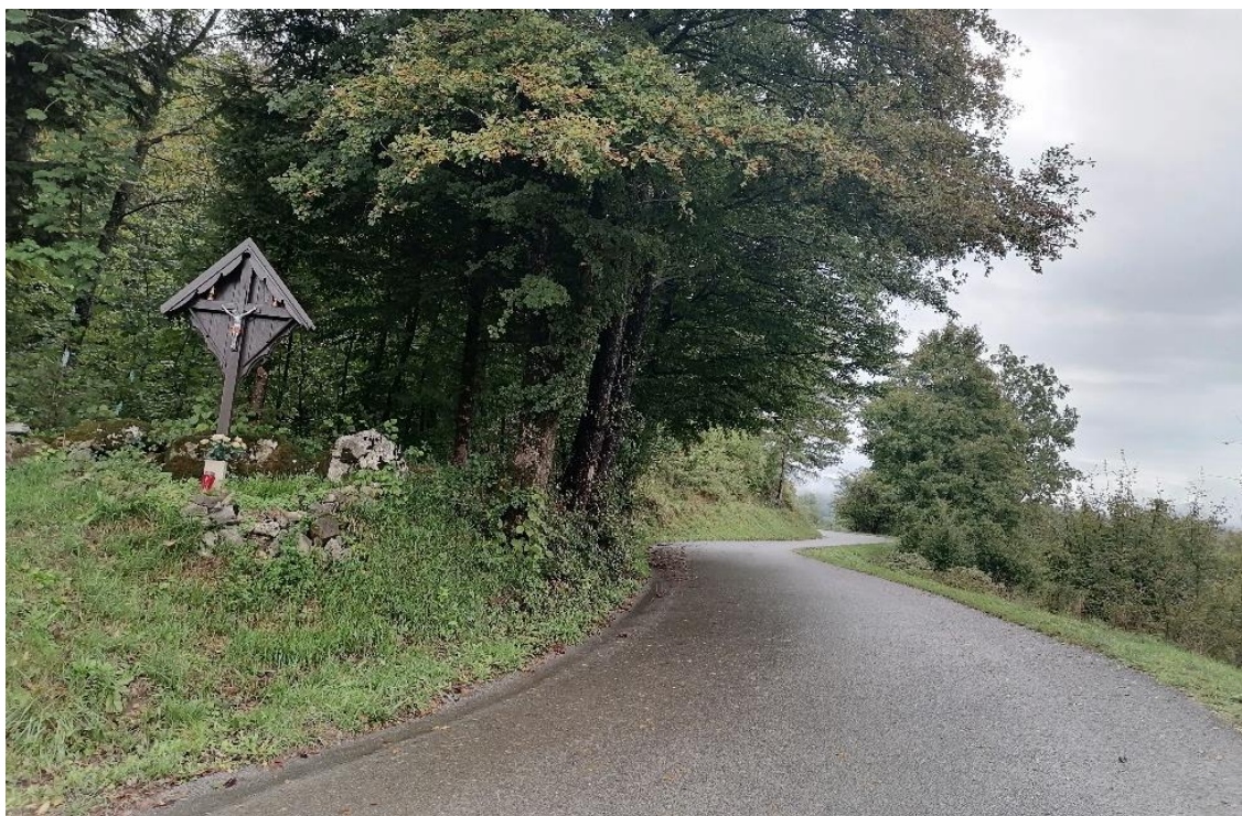
Slika 8: Del poti čez Vikernik

Pot čez Vikernik je sicer manj prometna, vendar kar ozka in na posameznih odsekih tudi nepregledna. Po mnenju nekaterih staršev je tudi na tem odseku težava v previsoki hitrosti vozil. Prav tako je bilo v anketi izpostavljeno kot nevarnejše križišče v Kuteževem pri hišni številki 6a. Na koncu vasi Kuteževo (v smeri proti Podgrajam) je sicer postavljen prometni znak z omejitvijo 40 km/h, kar naj bi prispevalo k nižji hitrosti vozil na tem odseku, vendar glede na anketo iz leta 2022, temu ni vedno tako. V preteklih letih je bilo postavljenih več prometnih znakov za omejitev hitrosti na 40 km/h, tako na relaciji Podgraje – Kuteževo, kot tudi na relaciji Kuteževo - šola, kar naj bi prispevalo k umirjanju prometa na omenjenih relacijah.