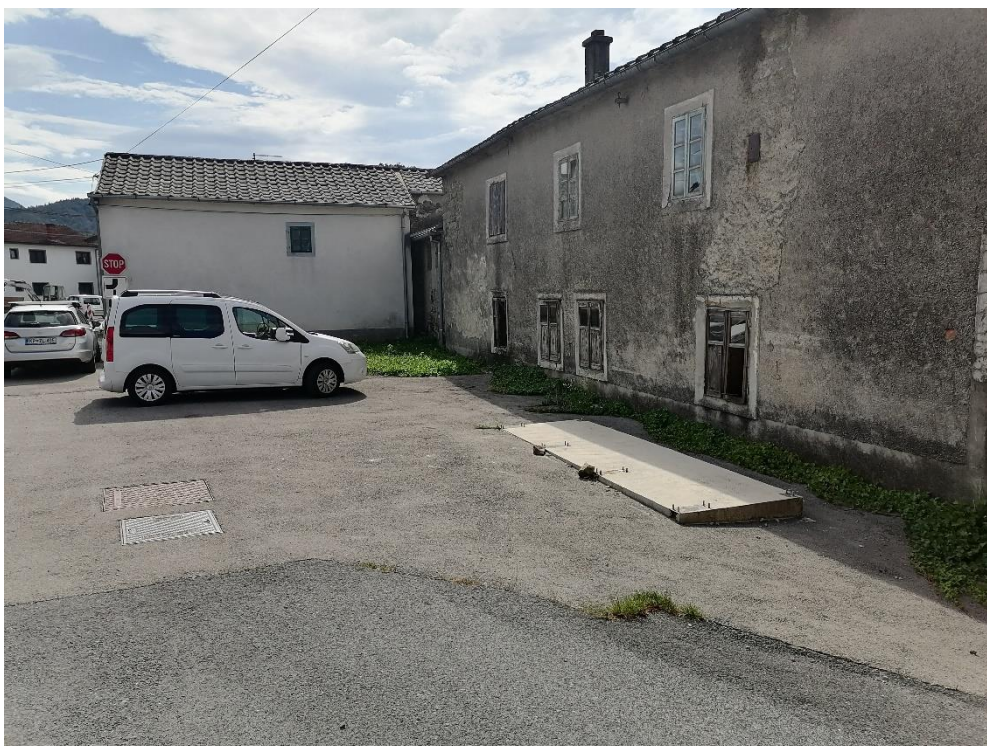
Slika 3: Mesto, kjer ustavlja šolski avtobus na Selih (vidna je tudi zastekljena postaja)